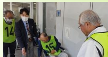
車いすの人の支援を学ぶ