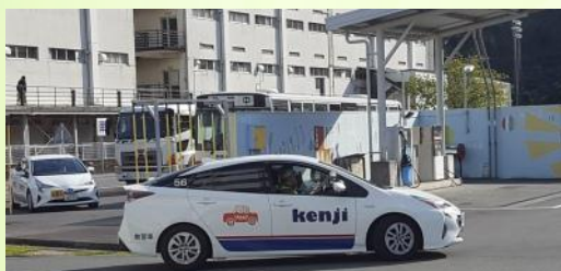
教習車を使用しての運転講習

本年度から市の高齢者のための支え合いの地域づくりへの支援の一環として実施する「地域支え合い出かけっCARサービス支援事業」を活用して西益津地区社会福祉協議会（以下「西益津地区社協」）が地区の高齢者のための買い物などの外出支援を行う取組のスタートを前に、平成31年4月16日（火）、静岡県自動車学校において、運転ボランティアを担う地区社協の会員が講習を受講しました。