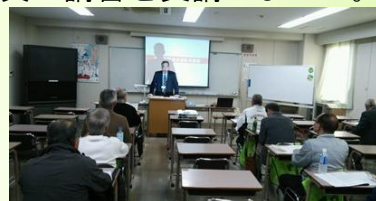
講義を熱心に聴く参加者

今後、西益津地区では、買い物支援等の利用を希望する高齢者を取りまとめ、テスト運行を重ね、夏ごろから本格的に外出支援のサービスを実施する予定です。