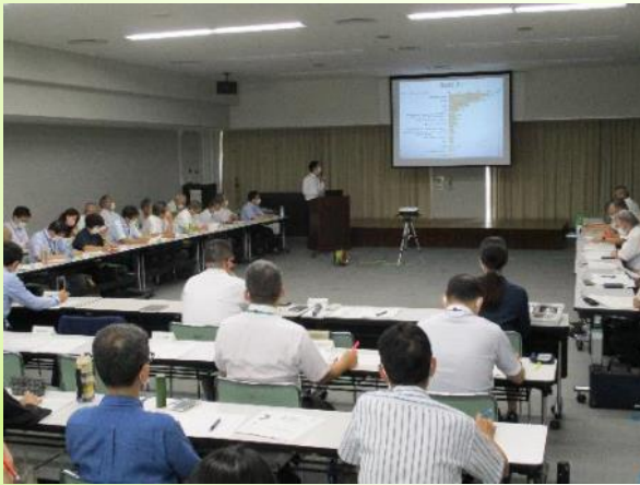
▲関係者約70名が参加

この研究会は、地域における住民主体の支え合いの取組を充実させ、誰もがいつまでも安心して住み慣れた地域で暮らせる地域づくりを推進するため、住民主体による高齢者の移動支援の手法等を研究する目的で開催しています。