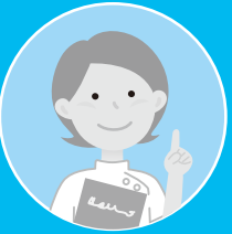
保健師又は看護師