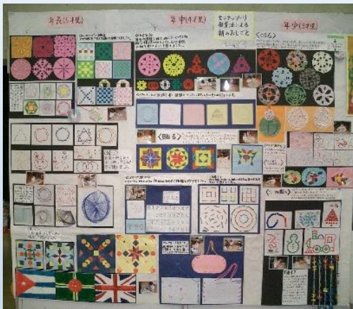
モンテッソーリのおしごと