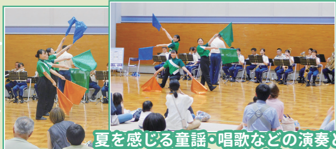
夏を感じる童謡・唱歌などの演奏と、 華麗に踊るカラーガードに魅了...