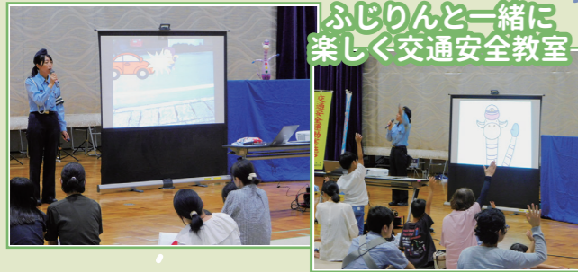
ふじりんと一緒に 楽しく交通安全教室

今回は静岡県交通安全協会藤枝地区支部、藤枝警察署、静岡県警察音楽隊を講師・奏者としてお招きしました。藤枝市交通安全キャラクターの「ふじりん」と楽しく交通安全を学び、自転車乗車時のヘルメット着用の重要性を教わりました。また、音楽隊の軽快な演奏と華やかなカラーガードの演技を楽しみながら、素敵なひとときを過ごすことができました♪