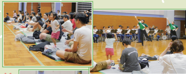
人気アニメソングのリズムにのって 心も体もウキウキ月