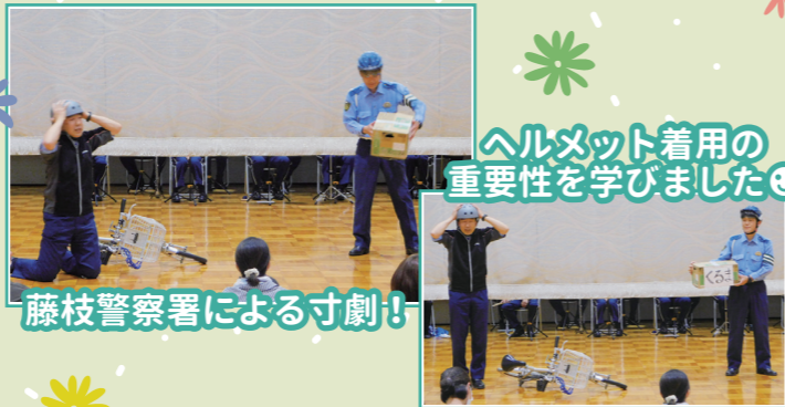
ヘルメット着用の 重要性を学びました◎