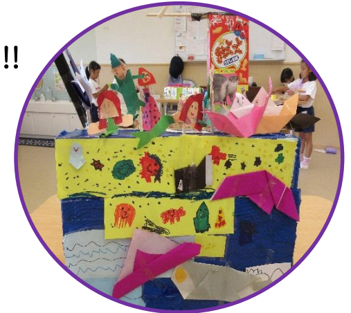
想像力を膨らませて作ります✧