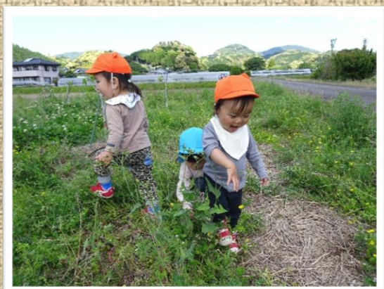
里山の自然がうれしい散歩道