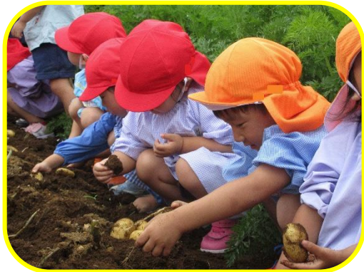
園の畑で野菜を育て、収穫します😊

「たくましく やさしい子」を園目標とし、様々な活動を通して自分で考えて行動できる子を育てます。豊かな自然の中で、のびのびと遊び一人一人の良さを見つけて伸ばします。