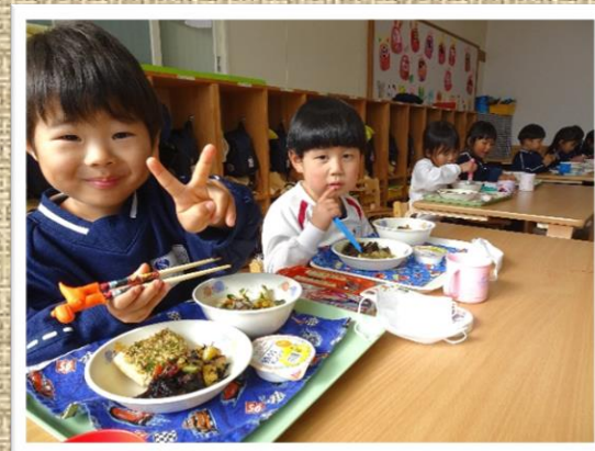
地元食材豊かな自園調理給食