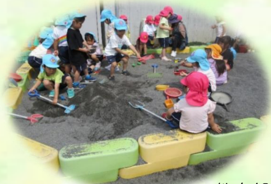
教育部：自由あそび