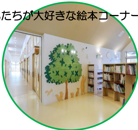
子どもたちが大好きな絵本コーナー♥