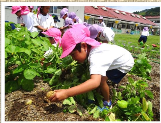
園庭の畑で野菜も子どもも育つ