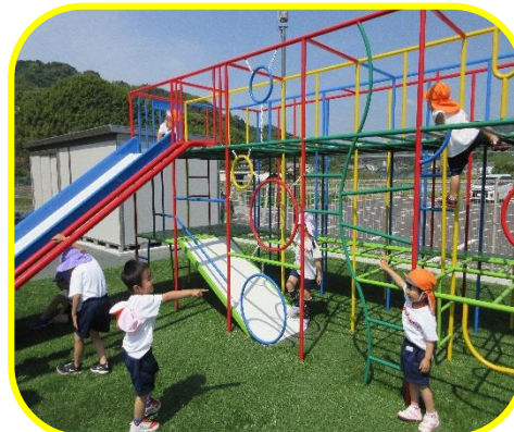
園庭にはたくさんの遊具があるよ!