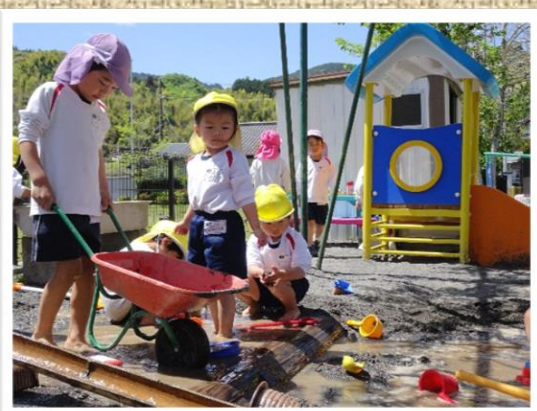
砂場の泥んこ遊びは大人気