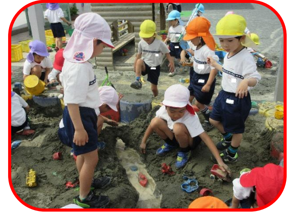
泥んこ遊び大好き!!