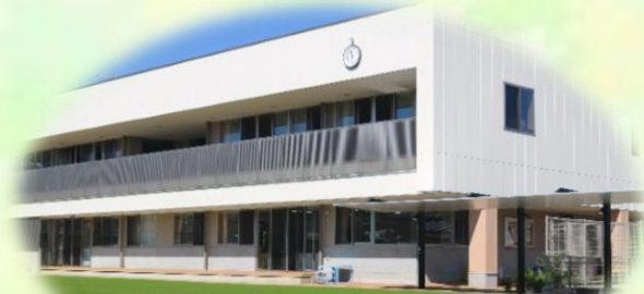
芝生の園庭は気持ちがいいよ！