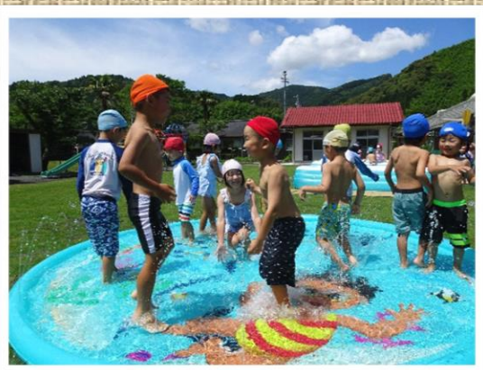
芝生の園庭はプール遊びもOK