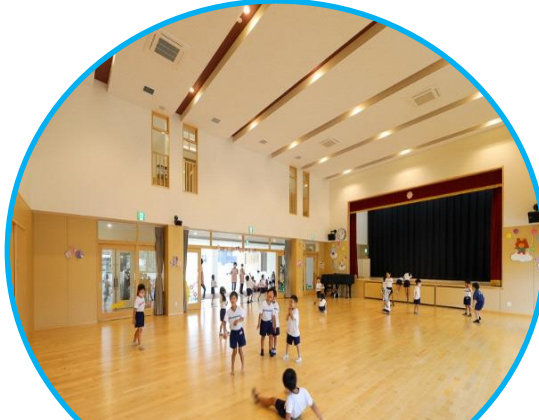
広い遊戯室で、発表会や色々な行事をするよ!!