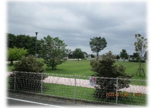
園庭のむこうは 内谷三輪公園