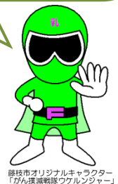
緑ヶ丘市オリジナルキャラクター「がん撲滅戦隊ウエルンジャー」

11 人に 1 人は乳がんになる時代。30 歳代から乳がんになる方が急増！！40、50 歳代でピークを迎えます。