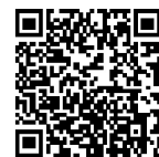
▲省エネ通知のページ QRコード