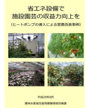
▲省エネで収益力向上を

省エネ機器の導入に加え、被覆の多層化や循環扇の導入、環境制御装置の導入など様々な手段を用いて燃料使用量50%以上削減に取り組みましょう！