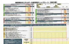
▲省エネチェックシート