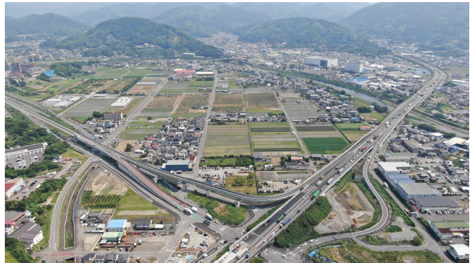
▲「食と農」に特化した産業集積が計画されている 仮宿地区