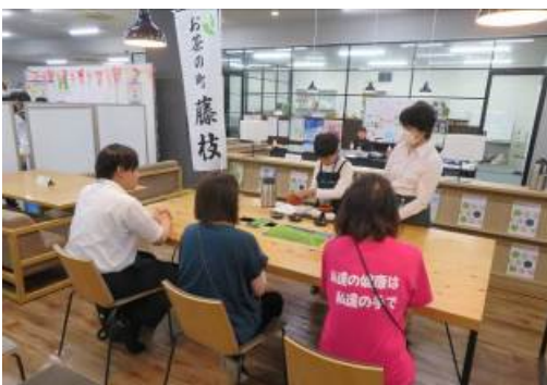
▲藤枝ジュニアお茶博士による呈茶サービス