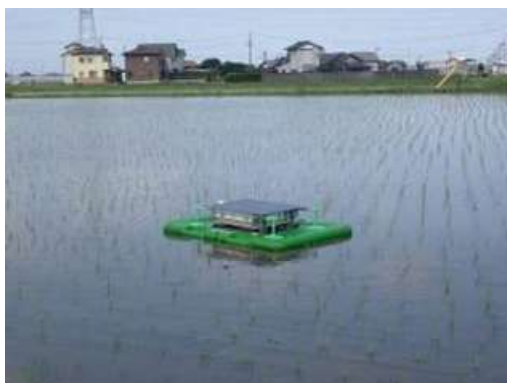
▲スマート農業機器（アイガモロボ）を活用した除草作業

ロボット、ドローン（※17）、AI（※18）、IoT（※19）などの先端技術を活用し、データを利用した生産、高度な環境制御装置を備えた施設園芸、スマート農業機器などを導入した次世代型農業に取り組む農業経営体に対し、各種補助制度を活用した支援を行います。また、農業と陸上養殖技術などを掛け合わせた新たな農業形態の取組を促進します。