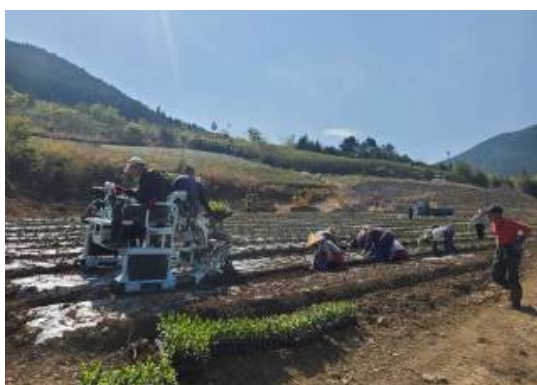
▲特徴ある藤枝茶の定植を支援