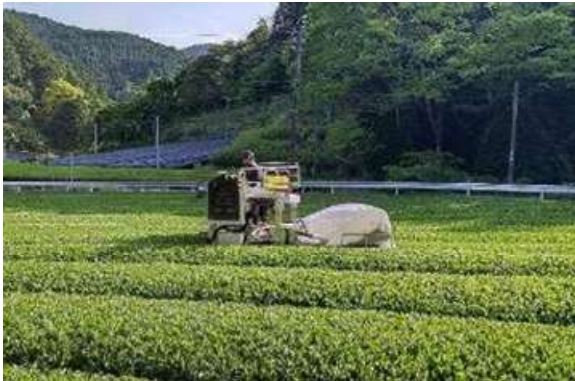
▲茶園への乗用型摘採機の導入

作業効率の良い機械の導入が可能な環境整備を進めるとともに、乗用型の摘採機や茶園管理機等の導入に対して各種補助制度を活用した支援を行い、本市の基幹作物であるお茶の生産効率化を促進します。