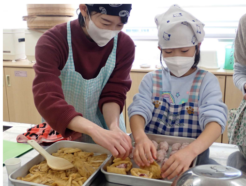
▲親子クッキングデー

農業協同組合（JA）、各種関係団体、農業者等と連携し、農業体験や市内産農産物を活用した料理教室等、市民が地域の食と農に親しむ機会をつくり出します。