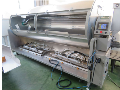
▲ドラム式萎凋機の導入