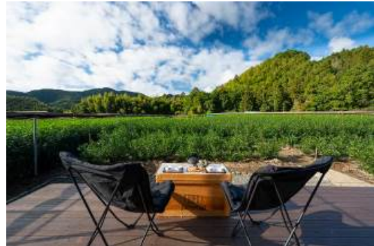
▲玉露テラス朝比奈