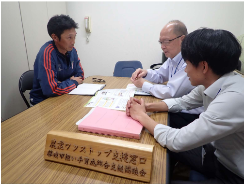
▲新規就農を支援する 農業ワンストップ支援窓口

ふじのくにフロンティア総合特区である仮宿地区の食と農アンテナエリアにおいて、食と農の連動による観光振興など、「食と農」に特化した新たな産業の集積を図ります。