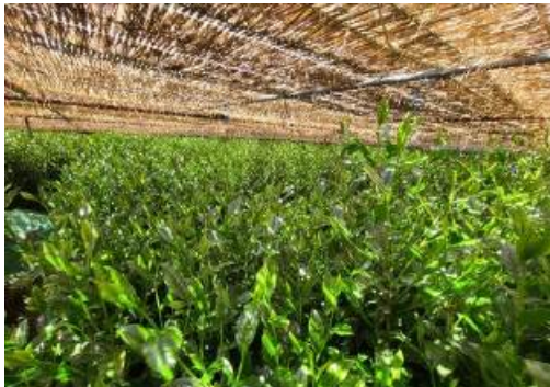
▲朝比奈手摘み本玉露の茶園

「とんがりぼう」（旧藤枝製茶貿易商館（※26））を茶文化発信拠点として、藤枝茶の歴史や伝統など茶文化を広く発信し、未来に伝えます。