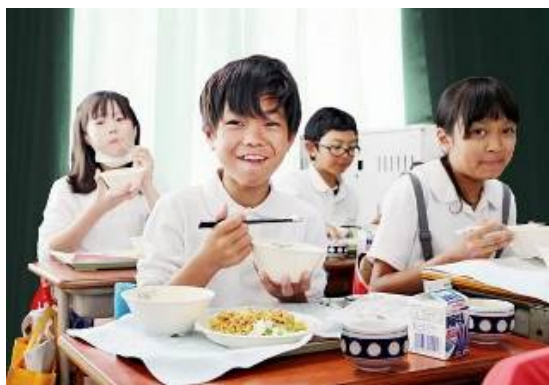
▲学校給食への提供