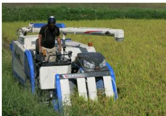
▲有機栽培による米づくり

学校給食等へ有機農産物の提供を行うことで、安定的な消費先を確保していくとともに、児童・生徒たちの健康や地域農業の学び、環境への関心といった食育を推進します。