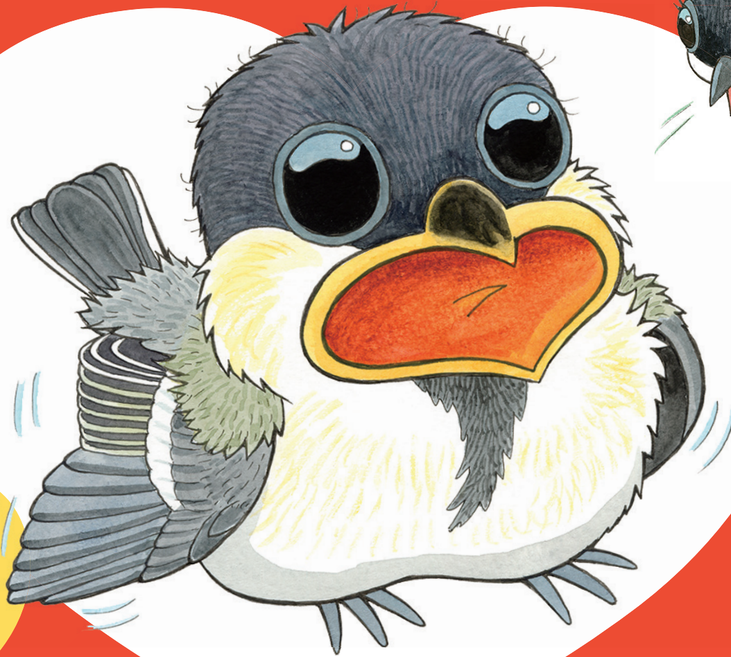
シジウカラのヒナ