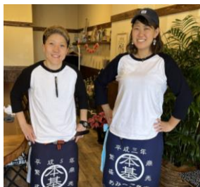
えーちゃん アミーゴ