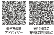
働き方改革アドバイザー 男性労働者の育児休業取得奨励金