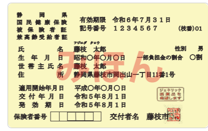
▲8月1日からは「クリーム色」

国民健康保険課 国民健康保険給付係 ☎643・33303 (保険証の更新について) ☎643・33349