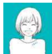
「空き家ゼロにのり」イメージキャラクター あきせろちゃん