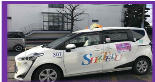
バス停型乗合タクシー運行開始

＜人の動き＞令和3年12月末日現在 人口：143,580人（前月比 -60人） 世帯：60,861世帯（前月比 + 6世帯）