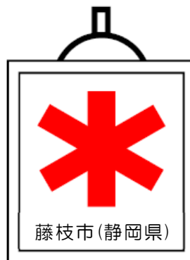
水は赤色、外は白色 形状については、適宜とする 【標燈】