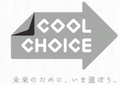
未来のために、いま選ぼう。

近年、自然災害の増加や異常気象など、地球温暖化の影響とされるさまざまな変化が起きています。そのため、2015年に国際的枠組み「パリ協定」が採択され、全世界で地球温暖化対策が進められています。地球温暖化の原因は、私たちの活動によって排出される温室効果ガスとされています。日本では2030年に向けて、この温室効果ガスの排出量を46%削減する目標を掲げました。「クールチョイス」とは、この目標達成のために省エネ・低炭素型の製品・サービス・行動など、地球温暖化防止につながる「賢い選択」をしようという取り組みです。