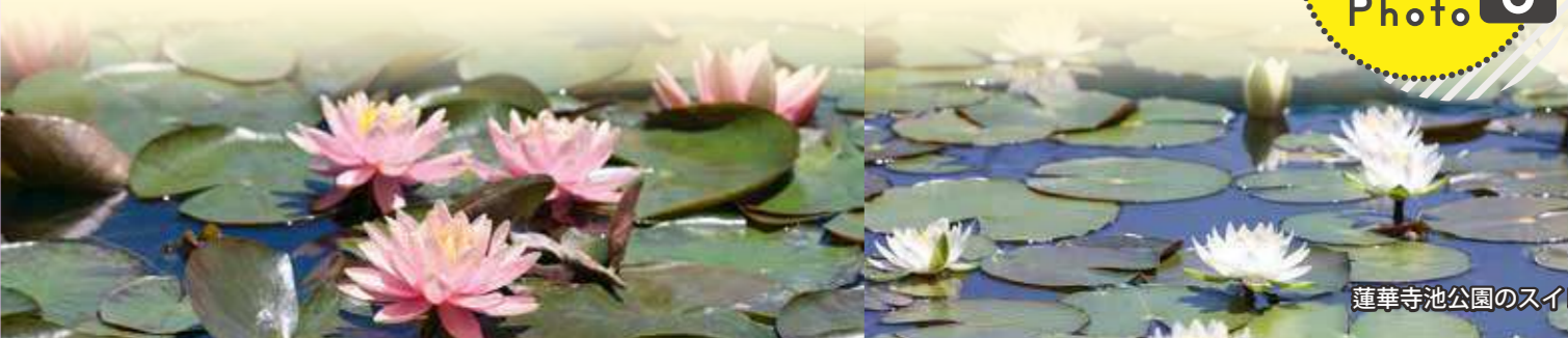
蓮華寺池公園のスイレン