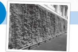
団体部門最優秀賞 西益津中学校

※詳しくは、市ホームページをご覧ください。 ※Eメール応募の場合は、必ず電話で送信確認をしてください。 ※過去に最優秀賞を累計5回受賞された個人または団体は、応募可能ですが、受賞対象にはなりません。