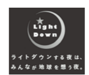
ライトダウンする夜は、みんなが地球を想う夜。