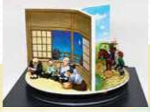
動くジオラマ「大御所家康と田中城のあの日」

実は、家康最後の外遊先が田中城だったのです。その日にいったい何が起きたのか？家康のこの一日をユニークなジオラマに仕立て、特別展「徳川家康と田中城」で初公開しています。ぜひご覧ください。