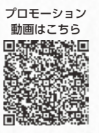
プロモーション動画はこちら

本市では、環境省が進めるクールチョイスに賛同し、平成30年5月に「クールチョイス宣言」を行いました。地球温暖化対策の新たな普及啓発活動「マイクールチョイス」ふじえだとして、市民・事業者・行政が一丸となってクールチョイスとつなぐ運動に取り組んでいます。その活動の一環として、地球温暖化防止につながるコンテストやキャンペーンの情報提供や市民の皆さんの取り組みを紹介するプロモーション動画を配信しています。皆さんも「マイクールチョイス」ふじえだに参加し、地球温暖化防止のため、環境によりことを実践しませんか。