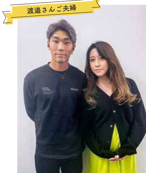
現在、藤枝MYFCで活躍中！