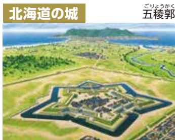
北海道の城 五稜郭