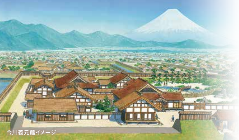
今川義元館イメージ