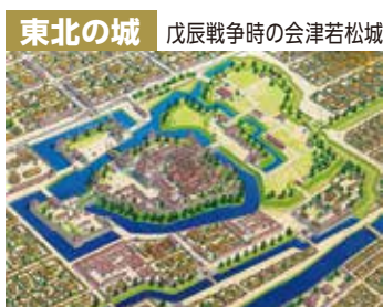
東北の城 戊辰戦争時の会津若松城