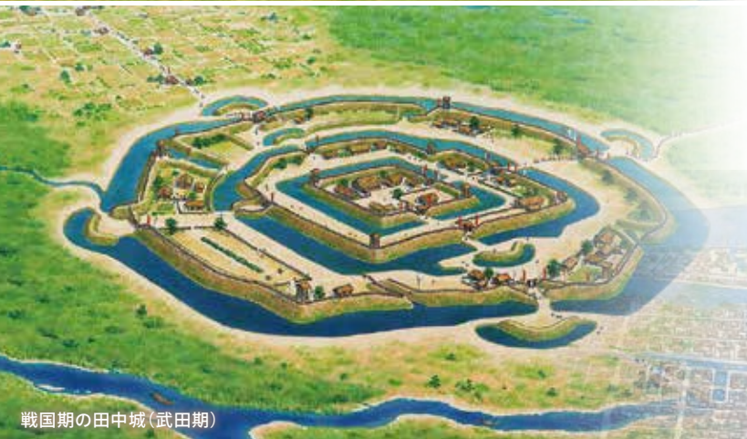
戦国期の田中城(武田期)