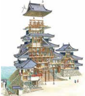
甲斐・信濃の城 松本城 天守断面