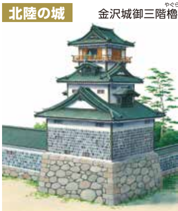
北陸の城 金沢城御三階櫓