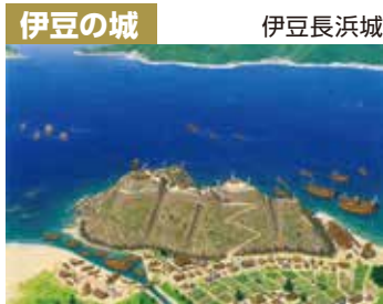
伊豆の城 伊豆長浜城